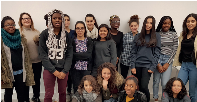
Promotion Wi-Filles 2017

C'est en renforçant la coopération École-Entreprise, que nous pouvons accompagner au mieux les jeunes à enrichir leur compréhension des avenir possibles, à développer leur autonomie, à acquérir et intégrer une vraie compétence à s'orienter dans le cadre de leur parcours éducatif et tout au long de la vie, vers une réelle inclusion sociale, culturelle et professionnelle.